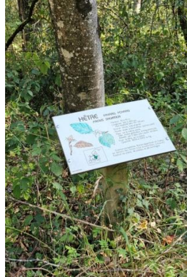
Petit Panneau Non Cartographié

Il existe de nombreuses souches et buttes de petites tailles non cartographiées mais ne gênant en rien le déroulé de la course sur chaque circuit.