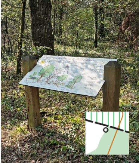
GROS PANNEAU Cartographié

Il existe de nombreux « petit panneaux » d'informations sur les arbres en bordure de chemin non cartographiés alors que les panneaux de grandes tailles le sont (voir photo).